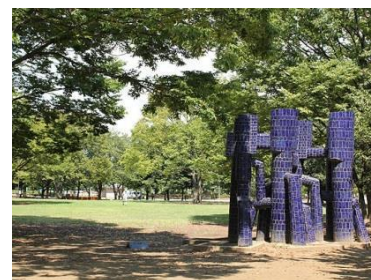
新小岩公園（徒歩5分）