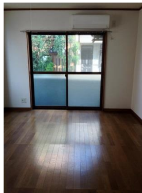
居室（キッチン／バス・トイレ別）