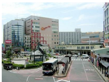
JR 総武線新小岩駅（徒歩10分）