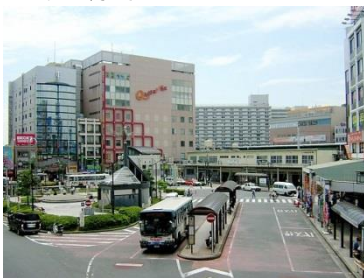
JR 総武線新小岩駅 (徒歩 10分)