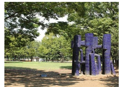
新小岩公園 (徒歩 5分)