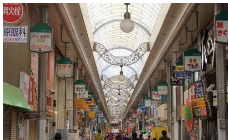
ルミエール商店街 (徒歩 10分)