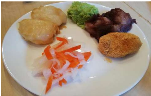
（↑からみ・ずんだ・あんこ・きなこ餅）

また、自動餅つき機を使い（今年は杵と臼は使えず。。）お餅をついて食べました。たくさん食べ過ぎて体重計に乗るのが怖いけれど、皆でダイエットできたらいいですね！