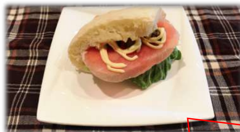
フォカッチャサンド

イタリアの北部にあるジェノヴァが発祥とされるパン、フォカッチャに生ハムやトマトを挟んでサンドイッチにしました。カリッとした生地に、塩気の効いた生ハムと特製のマヨネーズが相性抜群です