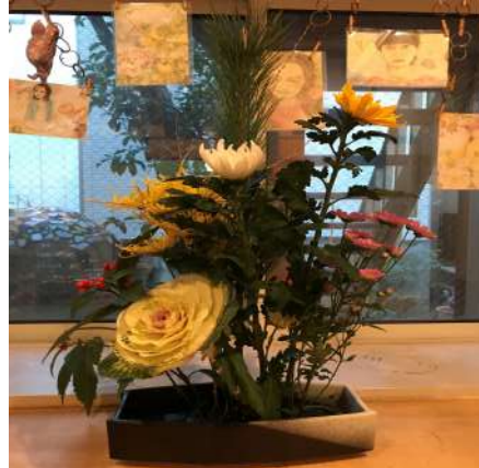
玄関用にお花を生けたり…（気分も華やかに！！）