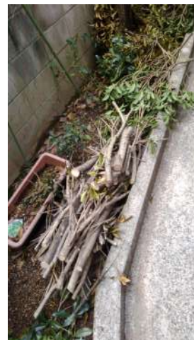
金木犀の剪定を行ったり…（お陰で鳥のフン被害がなくなりました！）