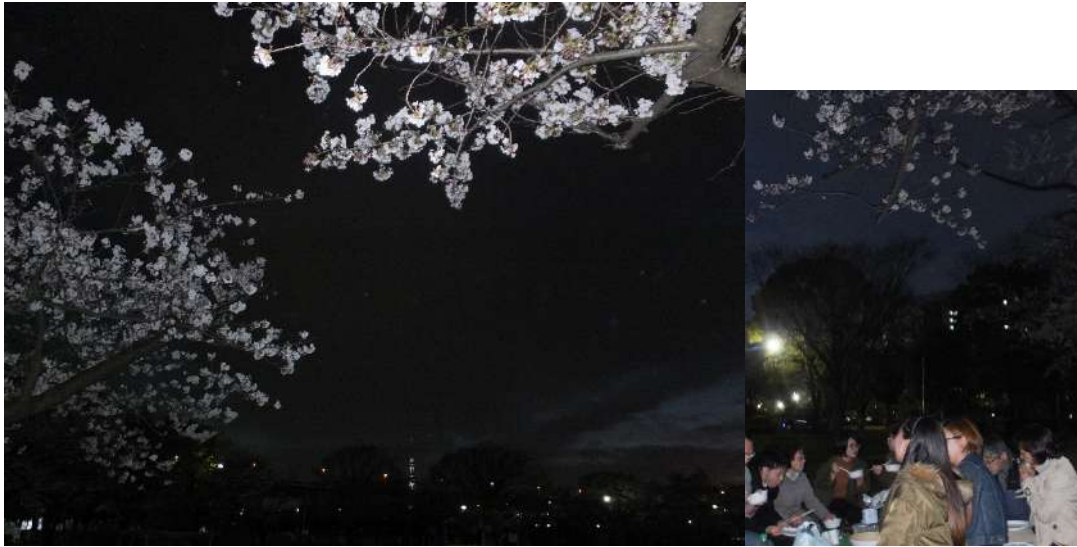
(スカイツリーと夜桜)