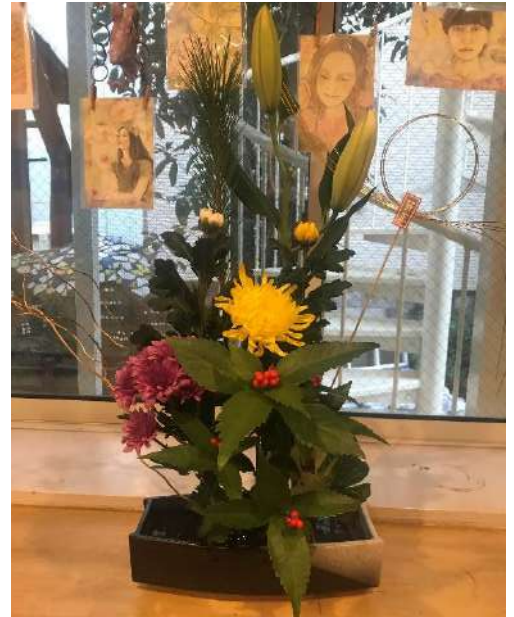
メンバーさんが活けたお花（玄関）